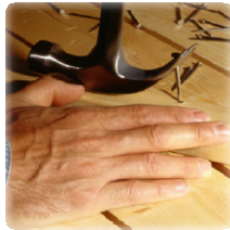
ພາບຂອງຊ່າງໄມ້ບໍ່ສາມາດຖອນຕາປູໄດ້ຫາກດ້ານປາຍຖືກຕີທົບໄວ້ແລ້ວ, ການສະແດງອອກເຖິງຄວາມເຊື່ອໃນພຣະເຢຊູຈະບໍ່ຖືກຖອນອອກໄດ້ ຫາກມາໂບດໂດຍຄວາມເຊື່ອ.

ດັ່ງນັ້ນທຸກຄົນທີ່.....ຕໍ່ໜ້າມະນຸດ ຝ່າຍເຮົາ.....ຕໍ່ພຣະພັກພຣະບິດາຂອງເຮົາ ຜູ້ຊົງສະຖິດຢູ່ ໃນສວັນເຫມືອນກັນ ແຕ່ຜູ້ທີ່.....ຕໍ່ໜ້າມະນຸດ..... ຜູ້ນັ້ນຕໍ່ພຣະພັກພຣະບິດາຂອງເຮົາຜູ້ ຊົງສະຖິດຢູ່ໃນສວັນເຫມືອນກັນ (ມັດທາຍ 10:32-33).